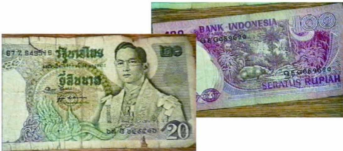
Слика 5. Новчанице земаља из којих су упућени џихад ратници н састав АРБиХ. Новчанице су пронађене код погинулих припадника муџахединских јединица.