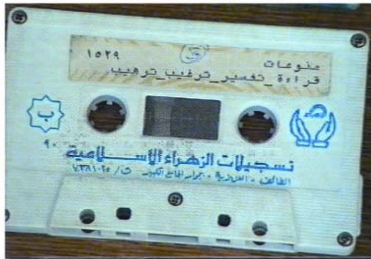
Слика 6. Аудио казете са снимљеним пропагандним материјалом на арапском језику у циљу едукације домаћег становништва и бораца АРБиХ.