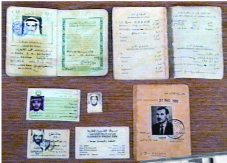
Слика 7. Документи погинулих муџахедина припадника АРБиХ