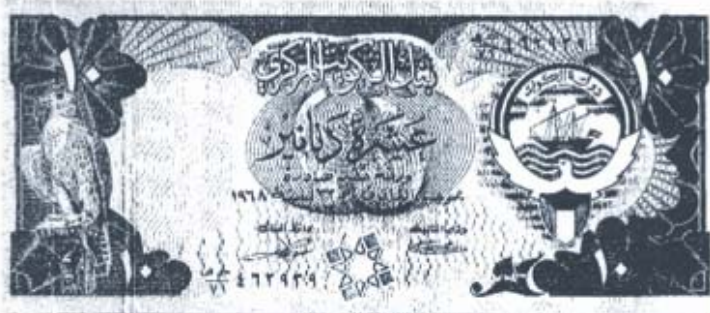
Слика 8. Кувајтски динари које је банка ставила ван снаге пошто је откривена илегална трансакција.